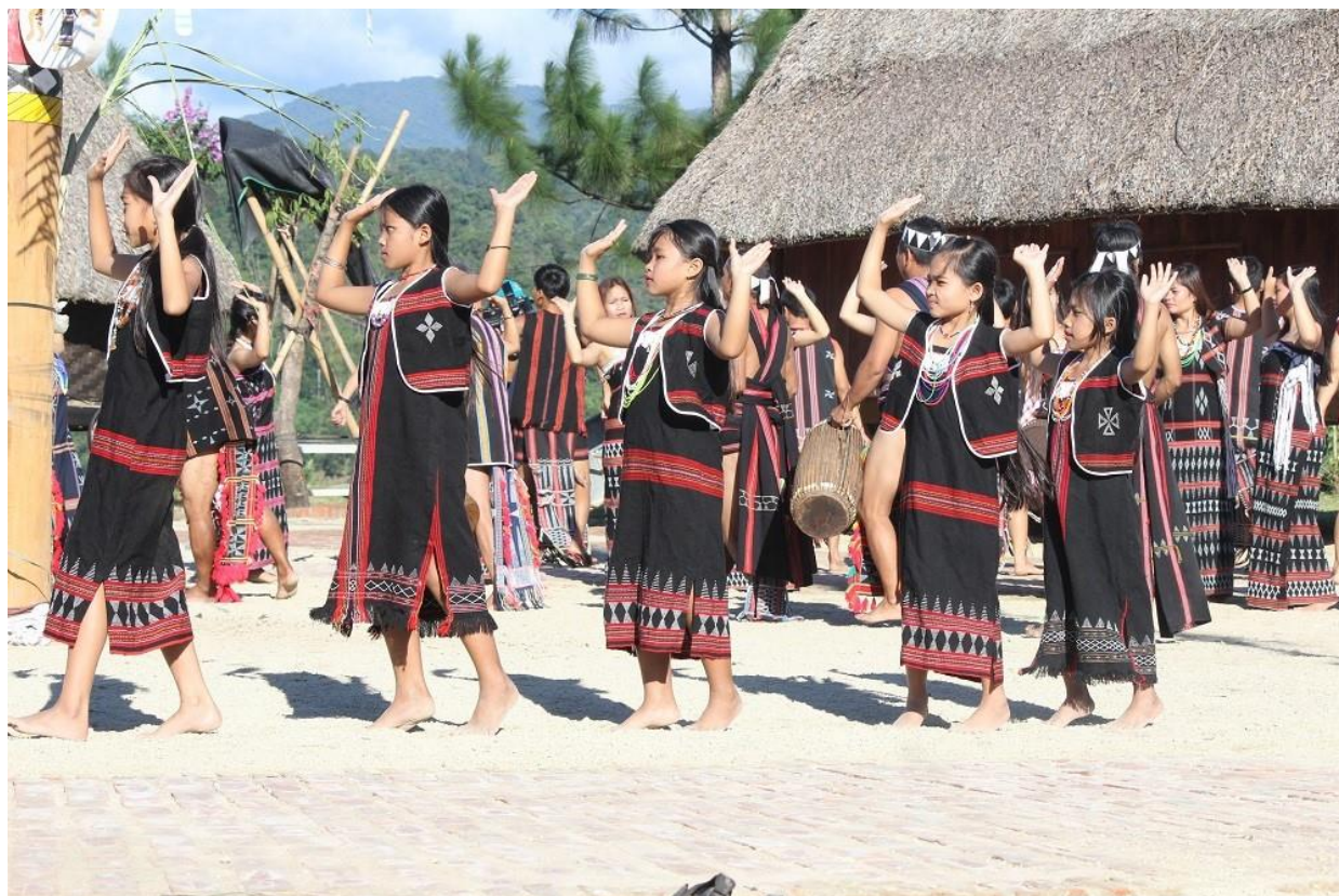
Trẻ em Cơ Tu múa tân tung da dả

Để thể hiện điệu múa tân' tung một cách sinh động giữa đại ngàn, đàn ông mặc khố, choàng một áo dẹt bằng thổ cẩm, chân đi trần lết đất, tay nắm chắc cây khiên, cây dáo, cây mác hay cây dụ, hoặc không thì nắm chắc tay bạn bên cạnh tung đôi tay lên vừa bước vừa hú một cách tự tin, sôi động và hùng dũng, thể hiện sức mạnh của trai làng, không sợ khi đương đầu với khắc nghiệt của thiên nhiên hay kẻ thù đến phá hại, đồng thời còn thể hiện niềm động viên vững tin, yêu cuộc sống, yêu làng quê, yêu núi rừng và nhắn gửi bằng thông điệp vũ điệu và ngôn ngữ múa hãy vui lên, vươn lên mãi trong cuộc sống bình yên hòa với màu xanh của núi rừng, bản làng quê cha đất tổ.