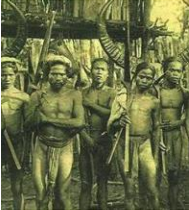
Chiến binh Cơ Tu (St)