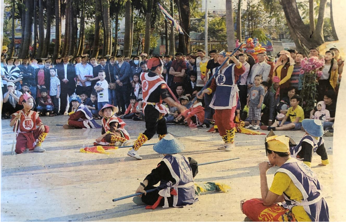
Cờ người